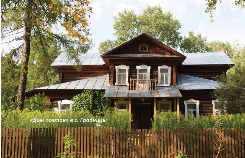
«Дом поэтов» в с. Градницы