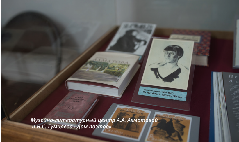
Музейно-литературный центр А.А. Ахматовой и Н.С. Гумилёва «Дом поэтов»